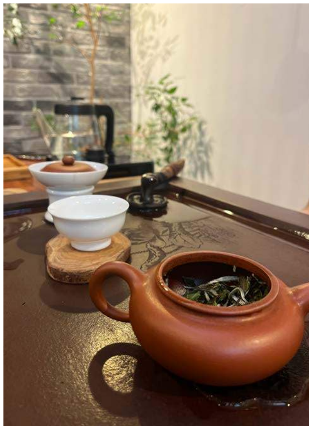
Malé radosti – čajový rituál s kolegyněmi