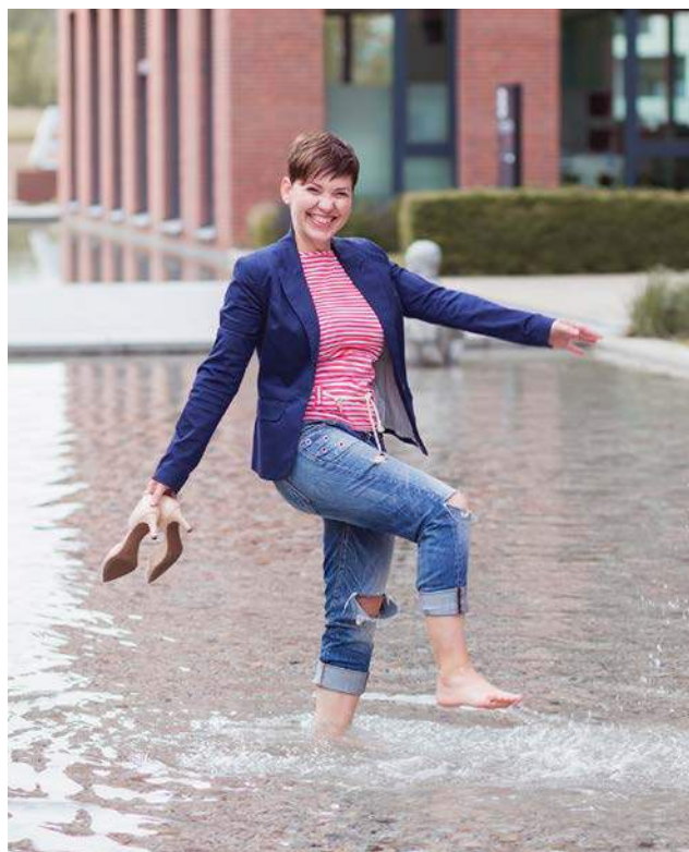
Co takhle osvěžení ve fontáně v polední pauze?