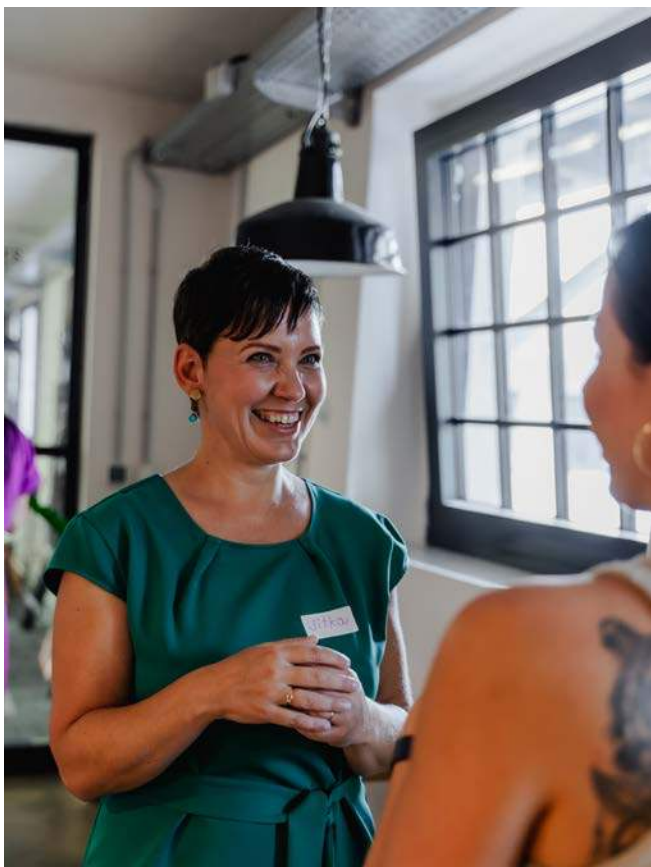
Z ikigai festivalu

Jednou jsem četla, že „v horách nebo na poušti potkáš sebe“, své demony, ale i své anděly. Vzpomněla jsem si na to, když jsem putovala v Peru vysoko v horách, všech osm nocí jsem během treku téměř nespala, vnímala jsem a slyšela, co se kde děje. Bývalo nějakých až minus 15 stupňů a já si někdy pod sebe dávala ruce, abych se víc zahřála. Přesto jsem byla šťastná a usmívala se. Byl to takový ten obyčejný vnitřní dobrý pocit z toho, že se na sebe mohu spolehnout, raduji se ze svých dobrodružství a nic moc vlastně nepotřebuji. Potkala jsem samu sebe, v nepohodě, namáhavých situacích i přenáherných výhledech. Vdechovala jsem ryzí život. A bylo to krásné. Jak se potřebujete potkat vy? A co z toho si můžete přenést do všedních dní?