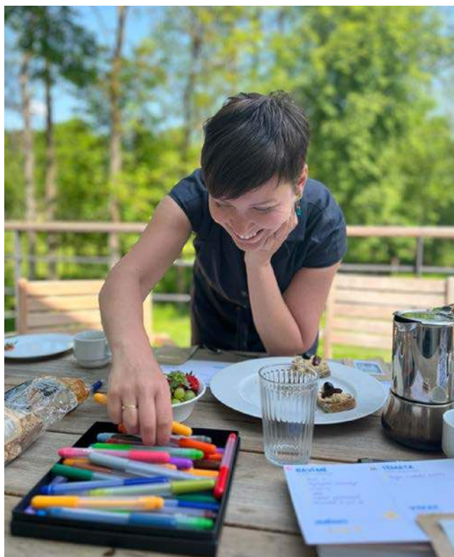
I pracovní úkoly mohou být zábavné.

Blíží se pomalu podzim a já cítím, jak se mi s úbytkem horkých dní (miluju chladno) navrácí mozek. :) Úplně se tetelím, že se rozjedou projekty, zahájíme výcvik ikigai a celkově se budu více věnovat vzdělávání